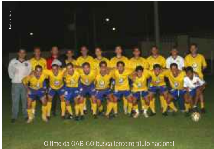
O time da OAB-GO busca terceiro título nacional