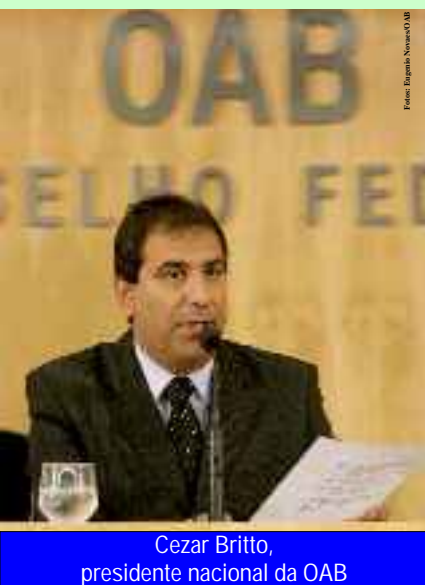
Cezar Britto, presidente nacional da OAB