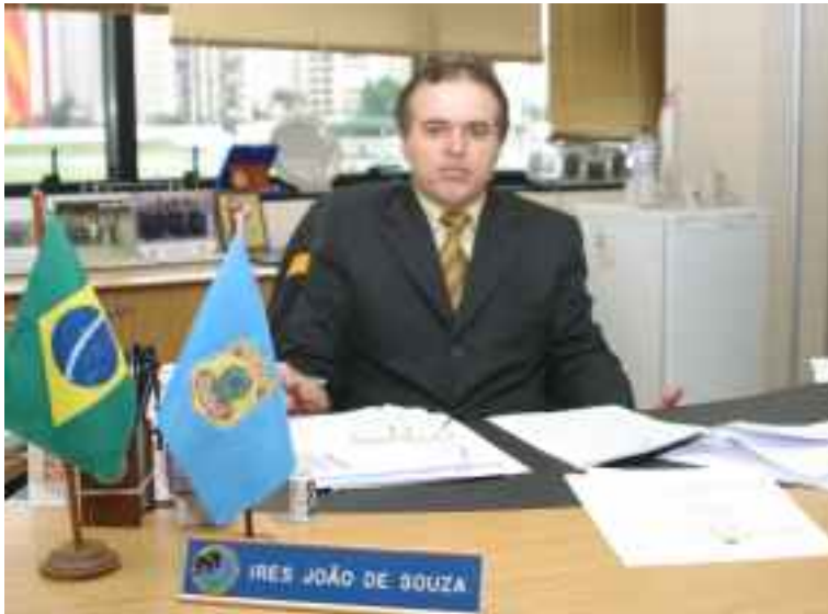
Delegado está aguardando laudos para concluir inquérito.

admitir, na época, que teria pago R$ 25 mil pelas provas.